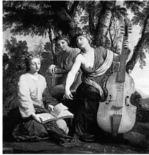
Musen mit Violone auf einem Gemälde des Franzosen Eustache Le Sueur (1616-1655)

griffe an das Wort Violone wie grosso, grande, contrabasso oder Wortverbindungen wie Baßviolon, Contraviolon werfen weitere Fragen auf.