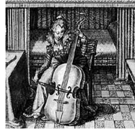
Violone spielende Dame, spätes 16. Jh.

wie beispielsweise in Sonaten von Giovanni Paolo Cima oder Dietrich Buxtehude beschäftigt sich der Studiengang mit der Vielzahl interessanter Solowerke für Streichbassinstrumente des 17. Jahrhunderts. Neben Stücken für „ Basso solo “ wie die Canzoni von Girolamo Frescobaldi – der kein bestimmtes Instrument zur Ausführung seiner Kompositionen festlegte – entstanden solistische Werke für Violone von verschiedenen Komponisten wie beispielsweise Giovanni Battista Vitali unter dem Titel Partite sopra diverse Sonate par il Violone sowie von Guiseppe Colombi Toccata und Chiaccona à Violone solo , Antonio Gianettis Sonata à Violone solo aus Balli e Sonate und Francesco Rognonis Suwana