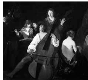
Violone auf einem Gemälde von Sir Peter Lely (1618-1680), um 1640

Im Hinblick auf Korpusgröße, Seitenzahl und Stimmung gab es keinen festgelegten Typus, sondern äußerst unterschiedliche Streichbässe. Konstante Merkmale der Familienzugehörigkeit, Baugröße und Stimmlage, Anzahl der Saiten, Spielhaltung, Stimmung, ob C- oder